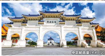
中正紀念堂(イメージ)