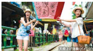
天燈上げ体験(イメージ)