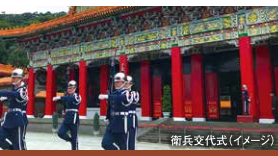
衛兵交代式(イメージ)