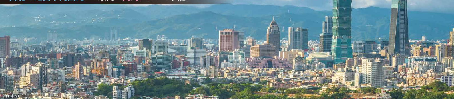
台北市内(イメージ)

人気の観光スポット九份・十分や 台北の定番市内観光にご案内&台湾グルメを堪能!!