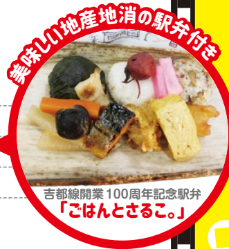
吉都線開業100周年記念駅弁 「ごはんとさるこ。」